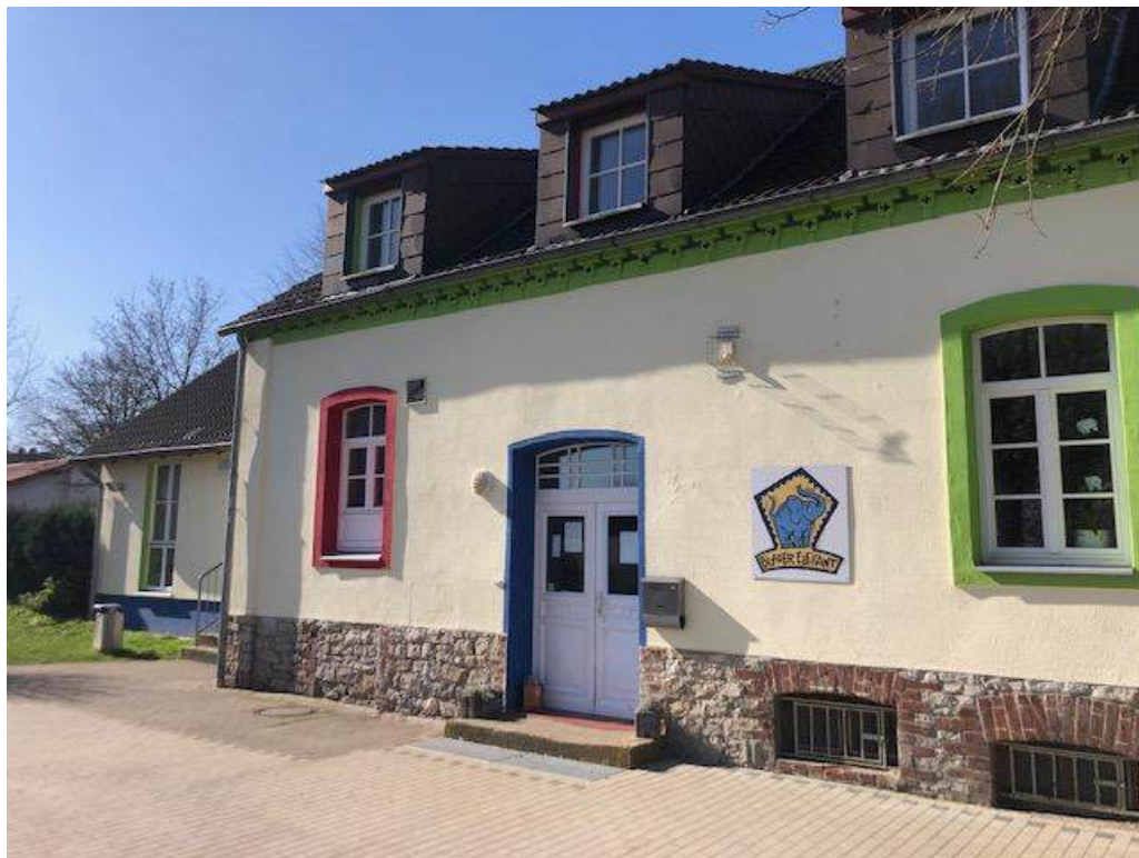
DKSB OV Lage e.V., Kinderhaus Blauer Elefant

Herausgeber: Deutscher Kinderschutzbund OV Lage e.V. Allensteiner Weg 3 32791 Lage Lage, November 2024